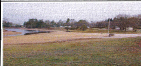
Photo de la zone de baignade