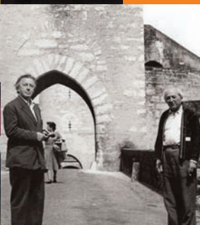
André Breton et Benjamin Péret à Cahors pour les Citoyens du monde