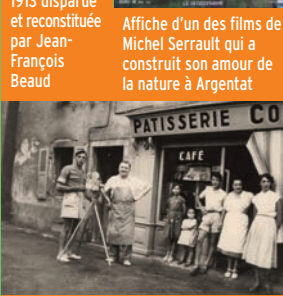
Tournage dans les années 1940