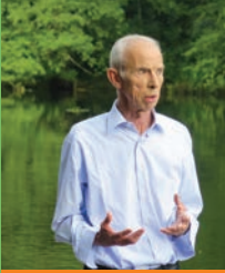
L'écrivain Pierre Bergounioux à Histoires de Passages