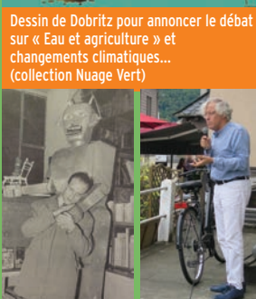
Boris Vian, auteur de la pièce Série blême, ici en décembre 1953 à la librairie La Balance