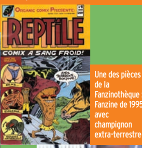
Une des pièces de la Fanzinothèque : Fanzine de 1995 avec champignon extra-terrestre