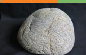
Galet roulé par la Dordogne, un des « cailloux d'Argentat » dans cette expo qui évoque aussi les mines (collection Nuage Vert)