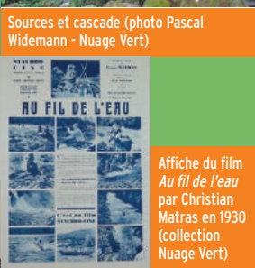
Affiche du film Au fil de l'eau par Christian Matras en 1930 (collection Nuage Vert)