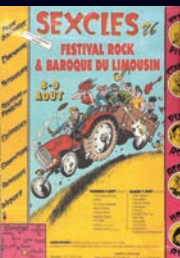
Affiche du festival rock punk de Sexcles en 1986 (collection Nuage Vert)