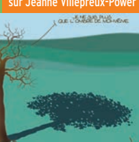
Dessin de Dobritz pour annoncer le débat sur « Eau et agriculture » et changements climatiques... (collection Nuage Vert)