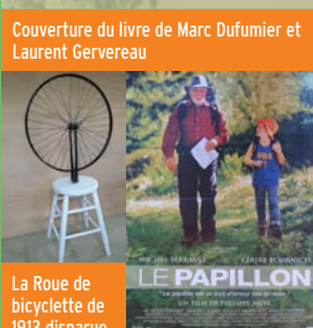
Affiche d'un des films de Michel Serrault qui a construit son amour de la nature à Argentat