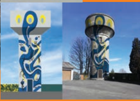
Le château d'eau de Sexcles revisité par Speedy Graphito et Lady M