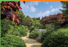
Les jardins Sothys à Auriac